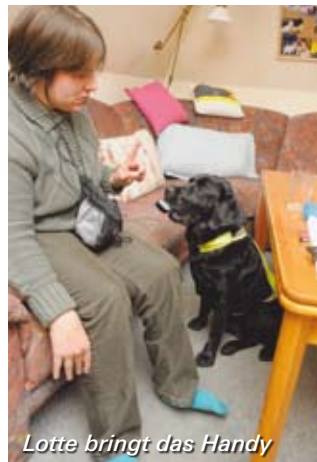
Lotte bringt das Handy